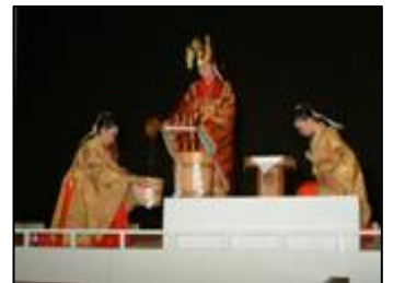
源泉のお汲み上げ