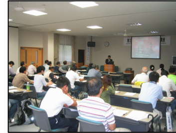
温泉観光士養成講座

草津温泉の魅力は、何と言っても泉質の良さと毎分3万2千リットル以上の湧出を誇る豊富な湯量。この温泉を観光と保養のために活かし、持続することが大切である。