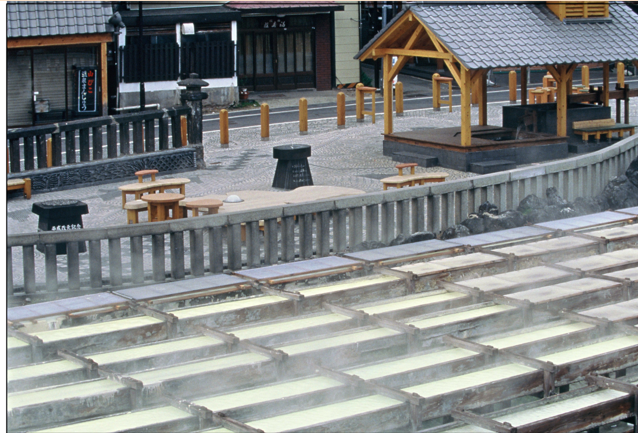
草津のシンボル「湯畑」の源泉