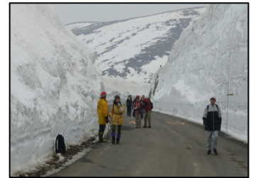
雪の回廊ウォーキング

特に毎年8月1日から3日に行われる「温泉感謝祭」は草津町のメインイベント。太古の昔よりこんこんと湧き出る温泉に感謝して行われるこの祭では、町の中心にある湯畑広場において、女神による源泉のお汲み上げの式典や歌謡ショーなどのイベントを開催。