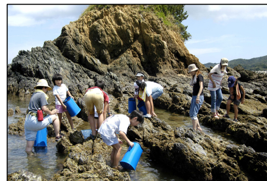
無人島での磯観察

離島を主なフィールドに、無人島での磯観察や島の路地裏散策などを実施。遊びながら自然環境や離島文化を学ぶことができるため、小学校の教育旅行の受け入れも多い。ツアーを主催する海島遊民クラブの代表は鳥羽の老舗旅館の若女将という顔を併せ持ち、旅館に隣接する場所にインフォメーションセンターを開設してエコツアーや市内の観光情報の提供を実施。