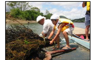
川漁師体験(しば漬け漁)