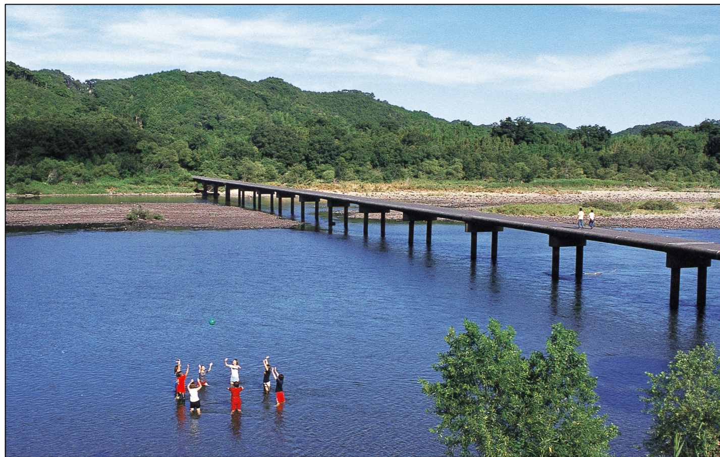
日本最後の清流『四万十川』と沈下橋

日本最後の清流『四万十川』に残される美しい景観を地域住民の協働により保全する取り組みを継続するとともに、四季毎の四万十川を体感出来るアウトドアや、地域風土により受け継がれる生活文化等、豊富な体験型観光メニューを提供することにより、滞在力を確保。