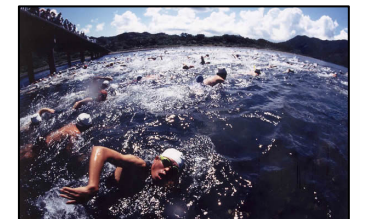
四万十川水泳マラソン大会

ボランティアは参加者に四万十川の魅力を体感していただこうと、早朝からの照明や、休憩所の炊き出し、大声の心温まる応援を行い、参加者にとっては強い記憶が残り、大会以後の広域交流や再度の参加が実現。