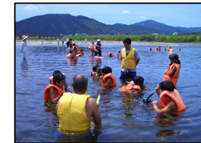
シュノーケリング体験