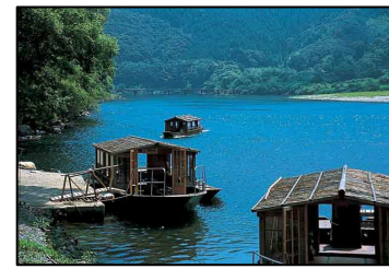
四万十川遊覧船(屋形船) 水辺のホタル群