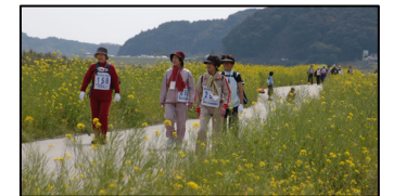
四万十川リバーサイドフルウォーク