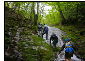
シャワークライミング体験

「山」「川」「海」全てが魅力の四万十川では、季節を体で感じるシャワークライミングや農家の日常生活を体験出来る農家民宿、流れに身をまかせるシュノーケリングやカヌーツーリング、伝統的な川漁師体験やホエールウォッチングなど多彩な体験型観光メニューの提供と、機材レンタル網や指導員・ガイドを豊富に保持。