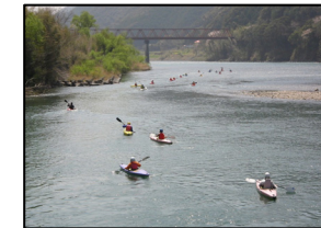
カヌーツーリング体験