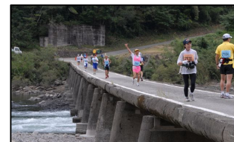
四万十川ウルトラマラソン

四万十川の清流を体感できるスポーツ大会には、毎年数百～数千人の参加者が、全国はもとより海外からも参加。これら大会は、参加者を上回る地域住民ボランティアが中心となり、コースの清掃・整備やお出迎え、運営・管理を実施。