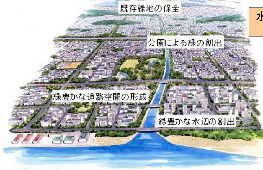
水と緑のネットワークのイメージ