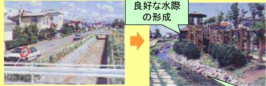
<安春川(札幌市)の事例>