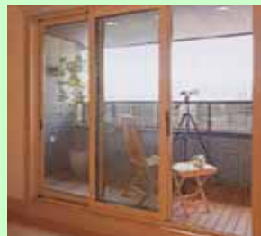
サッシへの活用例