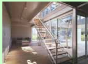
フローリングへの活用例