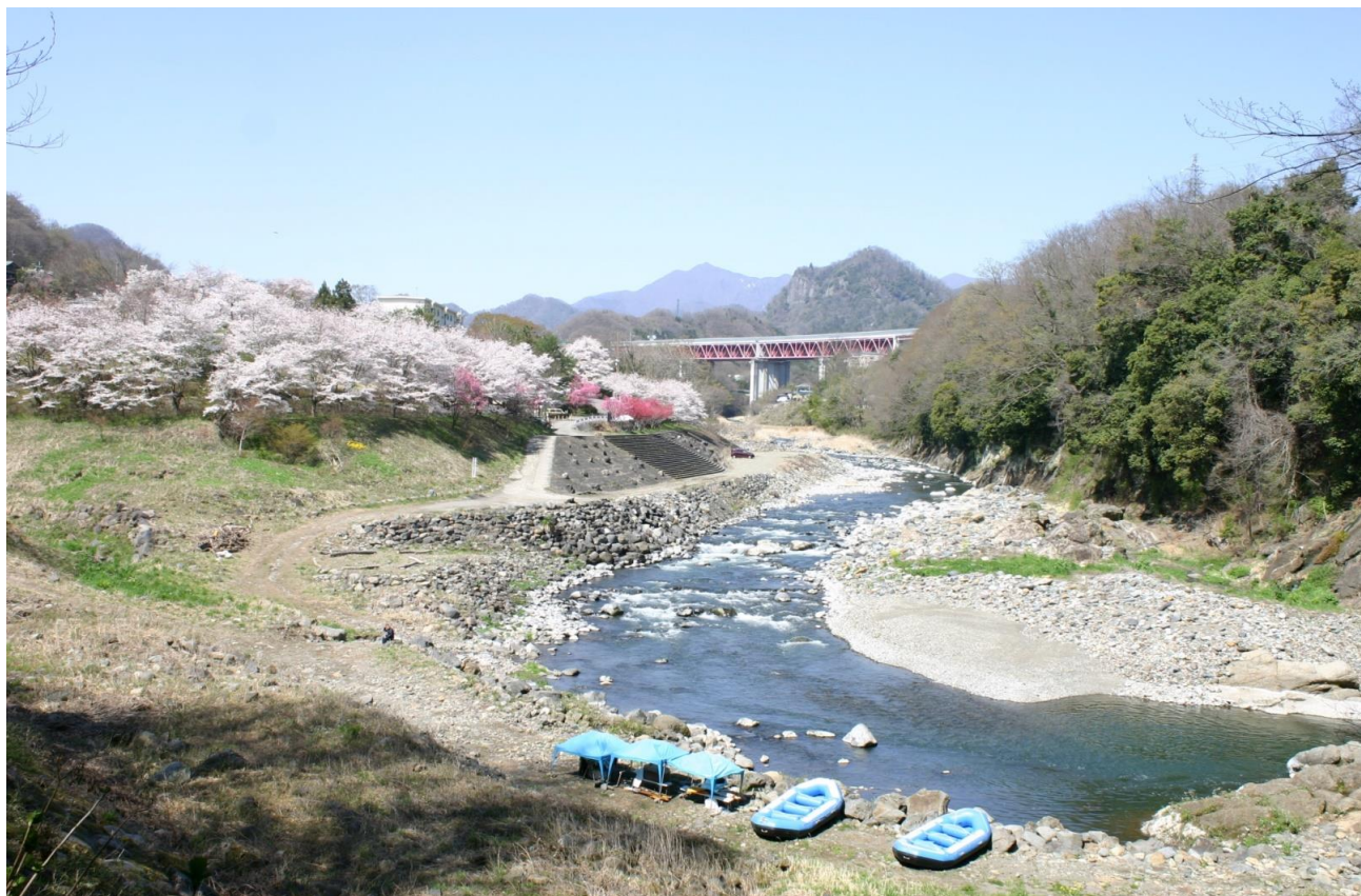
遊覧船乗り場から猿橋公園を望む