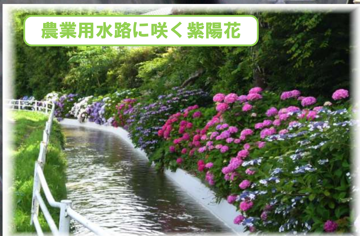
農業用水路に咲く紫陽花