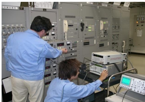
航空保安無線施設の点検