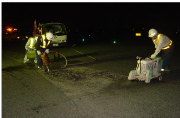
点検を踏まえた補修の実施