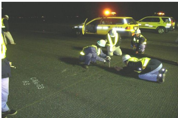
空港基本施設の点検

空港施設に異常が発生していないか、定期的な巡回点検により確認し、その結果等を基に航空機の安全運航に支障を及ぼさないよう、施設の機能を維持する為の補修等を実施