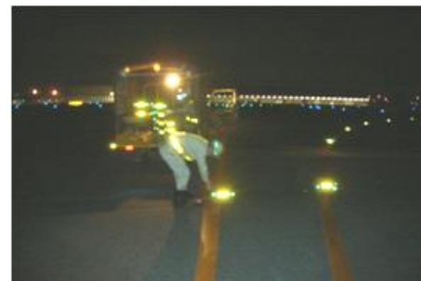
航空灯火施設の点検