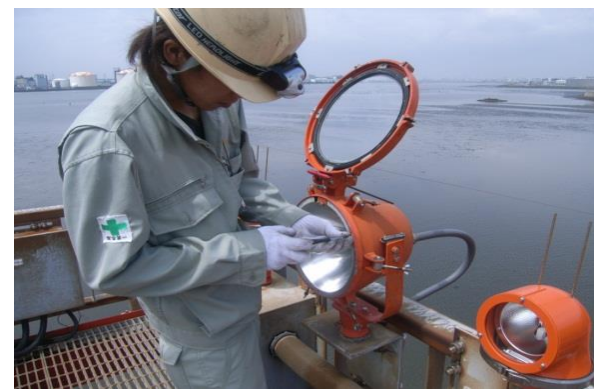
点検を踏まえた補修の実施