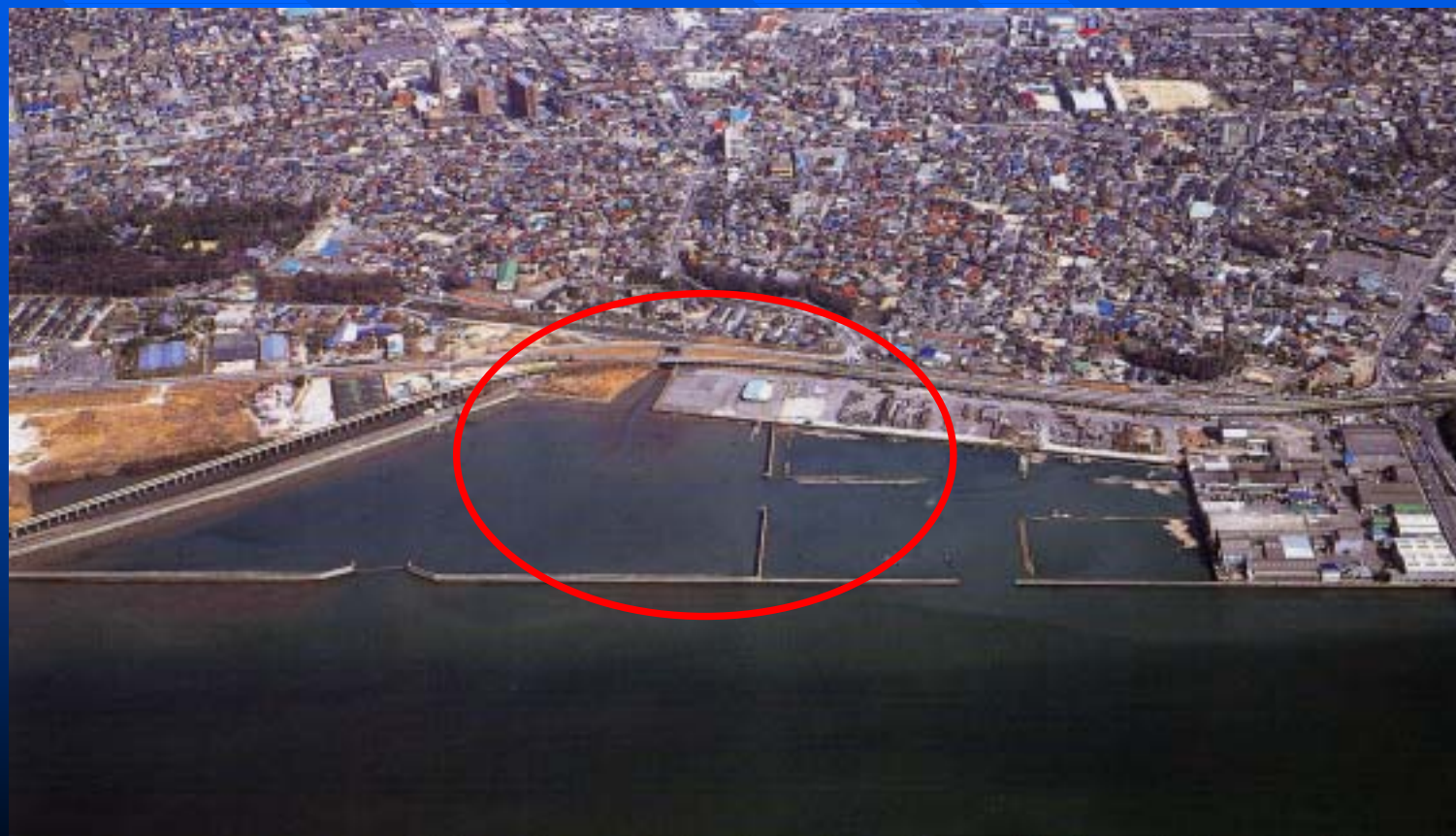
愛知県高浜市 衣浦港 高浜ふ頭