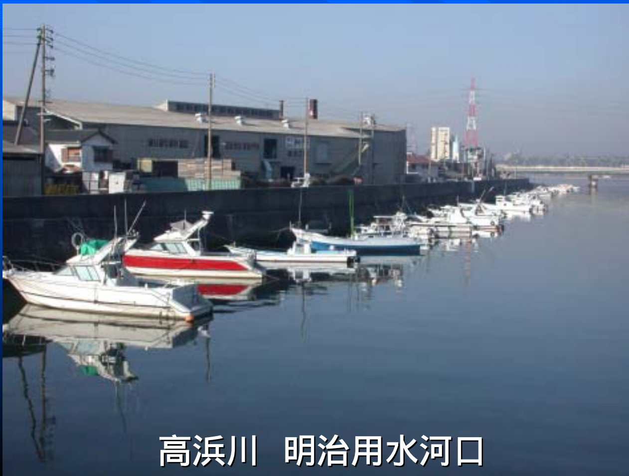
高浜川 明治用水河口