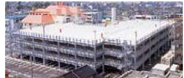
簡易立体駐車場イメージ