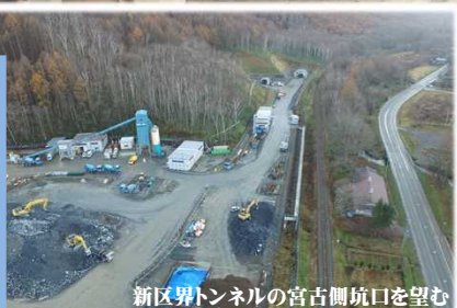
新区界トンネルの宮古側坑口を望む