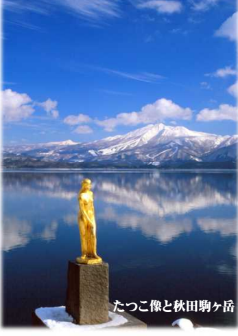
たつこ像と秋田駒ヶ岳