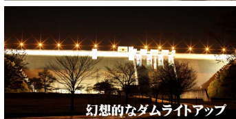
幻想的なダムライトアップ