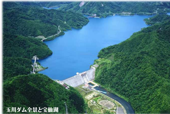
玉川ダム全景と宝仙湖