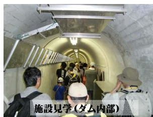
施設見学（ダム内部）