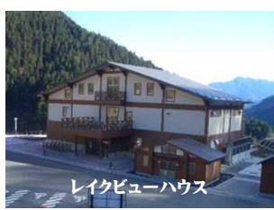
レイクビューハウス