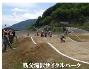
秩父滝沢サイクルパーク