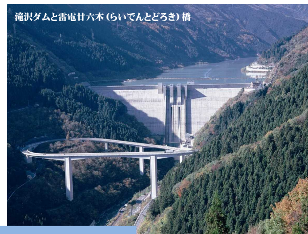
滝沢ダムと雷電廿六木（らいでんとどろき）橋