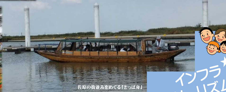
佐原の街並みをめぐる「さつば舟」