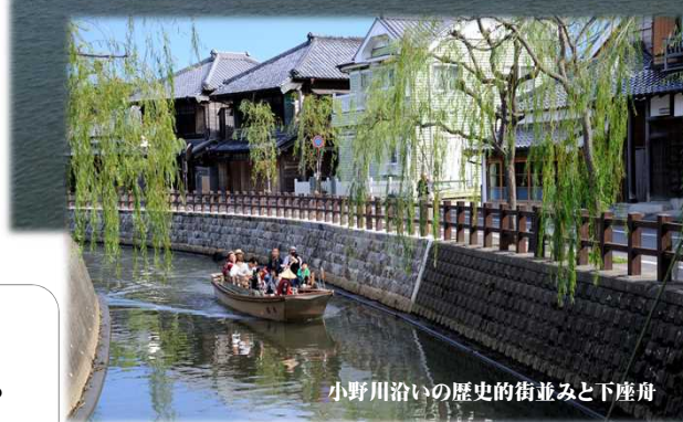
小野川沿いの歴史的街並みと下座舟