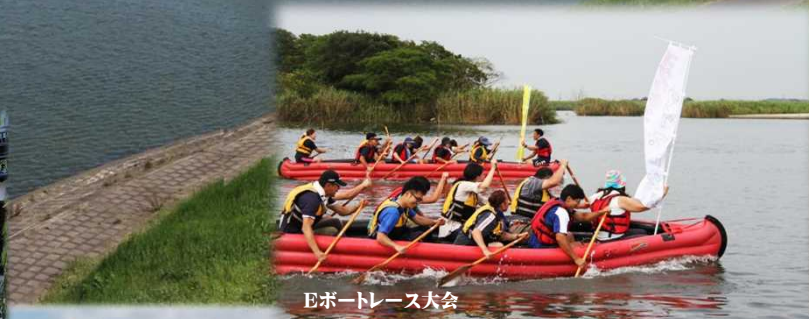
Eボートレース大会