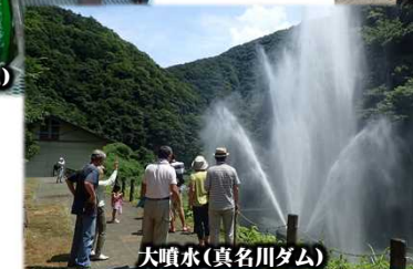
大噴水(真名川ダム)