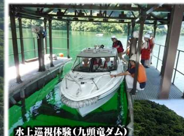
水上巡視体験(九頭竜ダム)