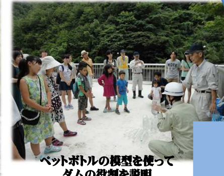
ペットボトルの模型を使って ダムの役割を説明