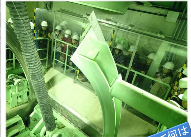
事前に申し込みればゲート室の見学も