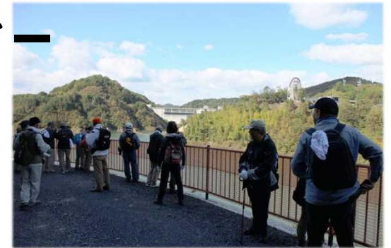
ウォーキング大会では、参加者が里山の自然を満喫