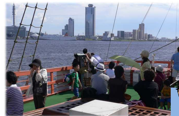
船上から大阪港を眺望される乗船客の様子 運が良ければ、大型クルーズ船も見ること！