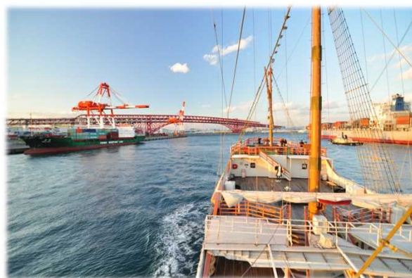
コンテナターミナル前面をクルーズするサンタマリア