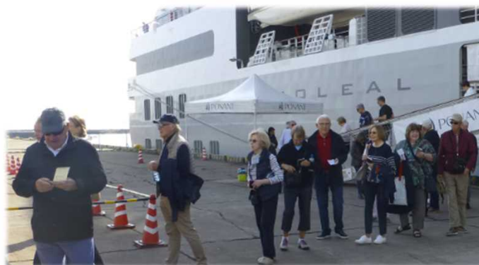
クルーズ船「LE SOLEAL (レ・ソレアル)」で 新宮港に降り立つ外国人旅行者