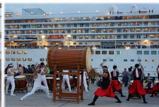
太鼓演奏披露によるお見送り（「飛鳥II」出港時）