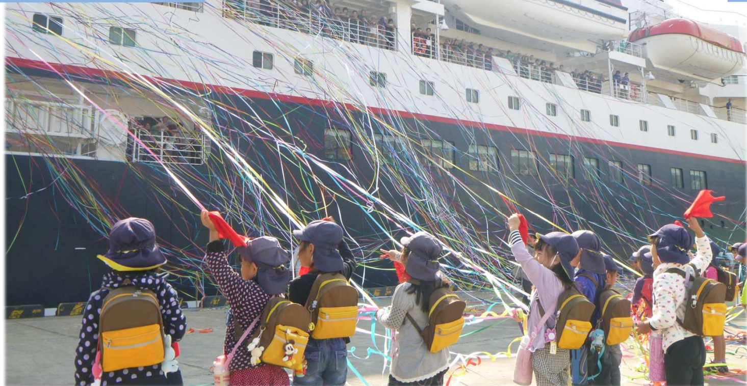
新宮港榎の木見送り隊によるお見送り（「にっぽん丸」出港時）

お問い合わせは、次のところまで。 和歌山県新宮市 企業立地推進課 TEL: 0735-23-3333 http://www.city.shingu.lg.jp/