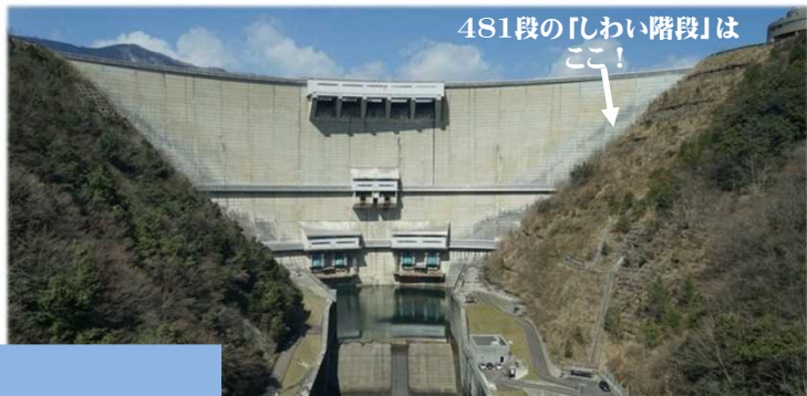
481段のしわい階段はここ!