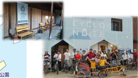
宿泊施設 “シクロツーリズムしまなみ”