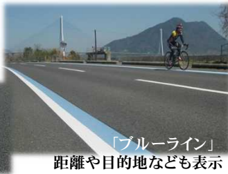
「ブルーライン」 距離や目的地なども表示