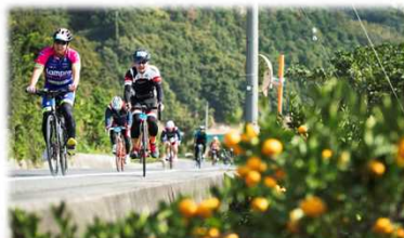
国際大会「サイクリングしまなみ」(2016.10) 国内外から約3,500サイクリストが参加