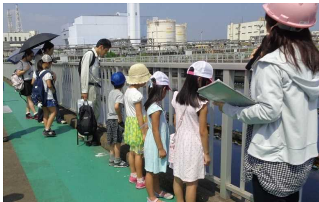
下水処理施設に興味津々な子供たち！

http://www.city.kitakyushu.lg.jp/suidou/s01300023.html