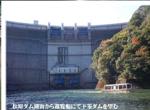
松原ダム湖面から遊覧船にて下釜ダムを望む