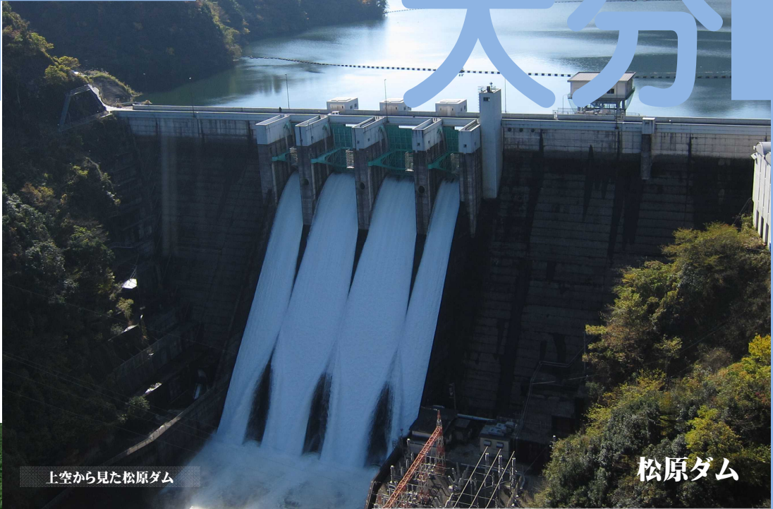
上空から見た松原ダム