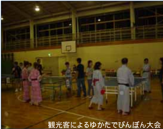
観光客によるゆかたでぴんぽん大会