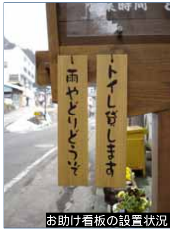
お助け看板の設置状況

また、温泉街に四万人プレート・四万人テキストを作成・配付して、四万温泉に関する知識・情報を啓蒙することで、観光客へのサービスを向上。