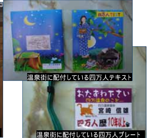
温泉街に配付している四万人テキスト