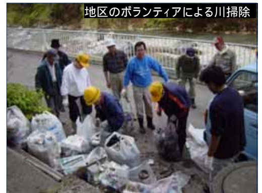
地区のボランティアによる川掃除

この活動により、自然の財産を子孫に残しながら温泉街の昔ながらの景観を維持している。