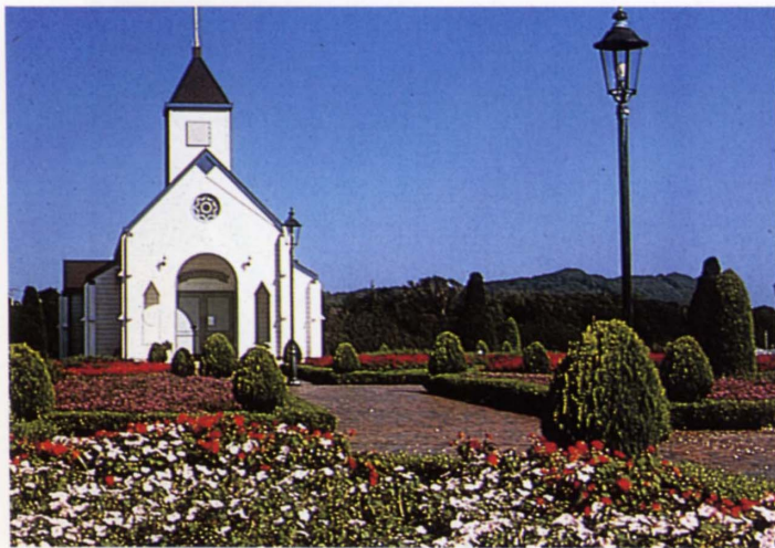
園内のローズマリーホール