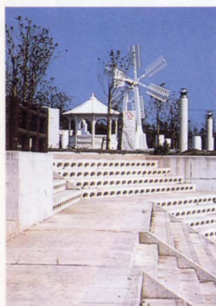
ウォーターフロントプラザと親水護岸