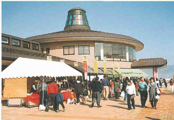
ふるさとマーケットでは農産物や加工品を販売している