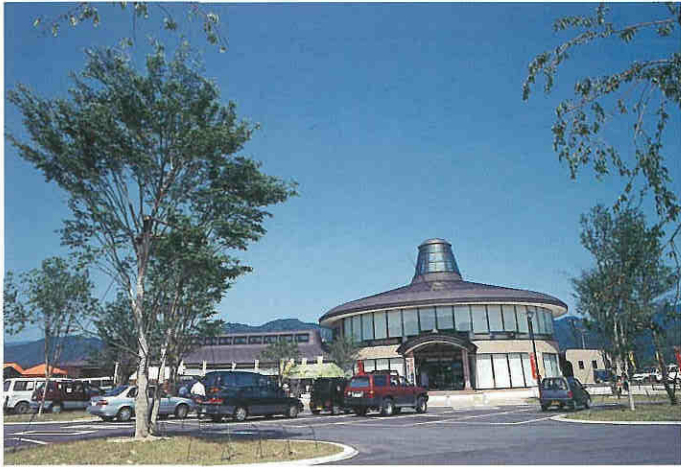
小町娘の市女笠をモチーフにデザインされた交流棟