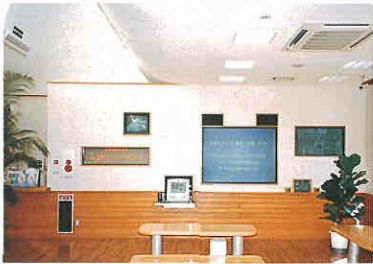
道路・観光情報等を提供する情報コーナー