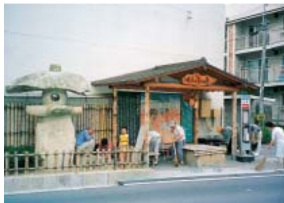
歴史伝承の施設を地域で維持管理することにより、そこから歴史は語り継がれる。