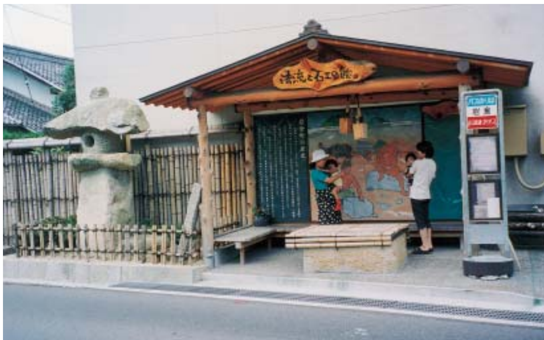
住民や通行人の憩いの場となっている

の憩いの場として活用されている。また、その周辺には竹柵を施したり、石臼や石灯籠を設置するなどして、歴史的な面影が表現されているとともに、ほっとする心の安らぐ空間となっている。