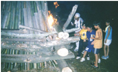
▲キャンプファイヤー