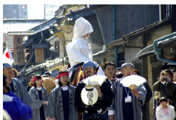
石畳の路上で結婚式