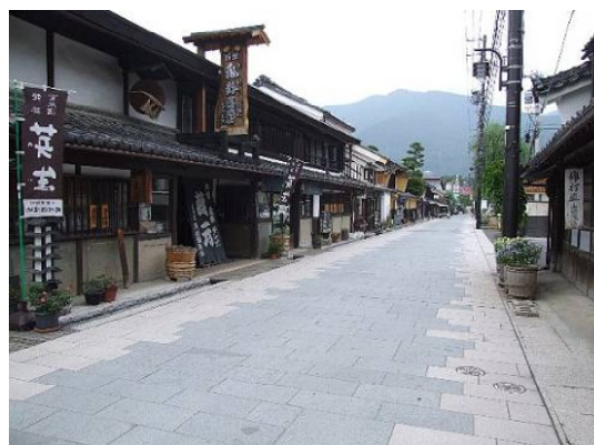
街並み整備された柳町