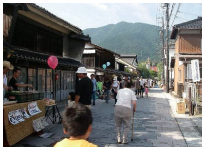
多くの人が集まる夏祭り

柳町では、協議会発足後9店舗が開店しており、中でも「コラボ食堂」は、主婦によるワンデイシェフの店として一般の主婦が約30人登録し、毎日、交代でランチを20～30食限定で提供する等、新しいアイデアなどにより、地域活性化を図っています。協議会では、さらに空き家、空き店舗などの解消に力を入れるため、平成22年6月に「柳町まちづくり会社」を設立し、更なる街の活性化への活動も進めています。