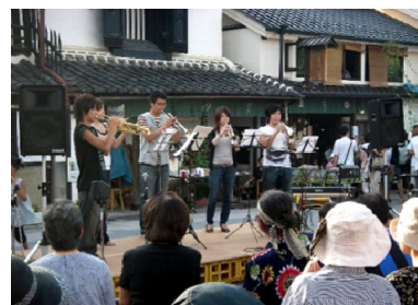
歴史的街並みをバックに開催された街角コンサート