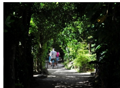
レンタサイクルで「フクギのトンネル」を楽しむ来訪者