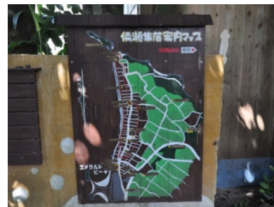
備瀬区民が製作した「備瀬集落案内マップ」