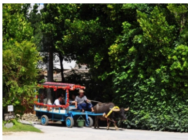
「水牛車」でフクギ並木を周遊する来訪者