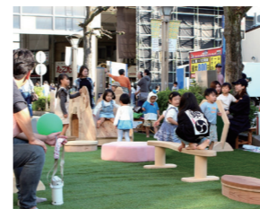
多様なイベント開催へ