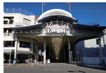
本町通りアーケード