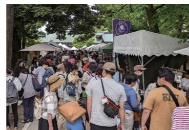
杜の宮市での真清田神社境内