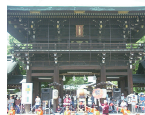
平成13年第1回杜の宮市

20年の経験を地域へ還元し、志民連いちのみやは都市再生推進法人として一宮市ウォーカーブル社会実験事業を民の側から推進、多様な主体の多様なイベントが開催されるようになっていきます。