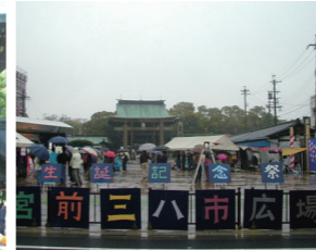
平成15年宮前三八市広場完成