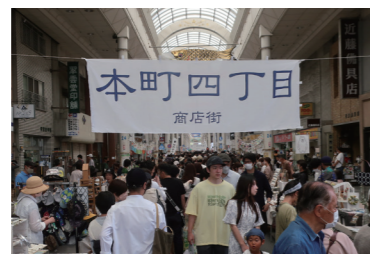
杜の宮市での本町通り