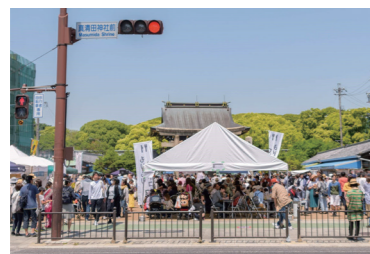
杜の宮市での宮前三八市広場

ンあふれる手づくり文化の発信地としたいという思いから、真清田神社を基点にアートクラフト市「杜の宮市」を平成13年に開始しました。やがて宮前三八市広場や市道0135号線の公共空間等を活用し、衣食住全てと運営も手づくりの「杜の宮市」を官民連携もしながら20年以上継続しています。