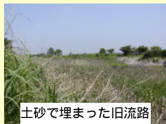
土砂で埋まった旧流路