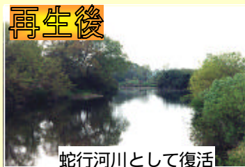
蛇行河川として復活