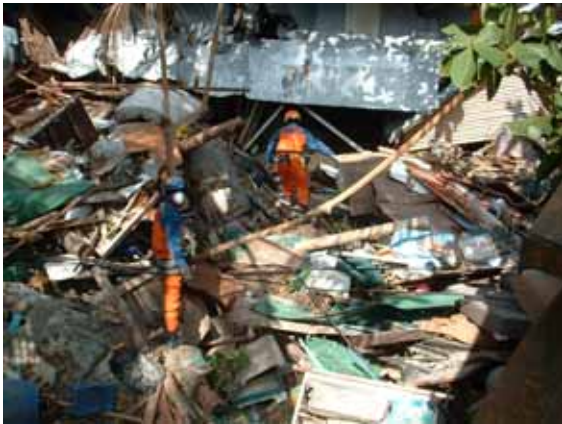
がれきの中を搜索する隊員(12 / 31)