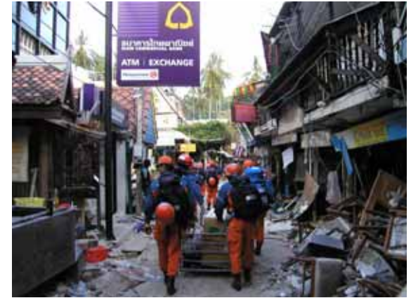
ピピ島内での移動(12 / 31)