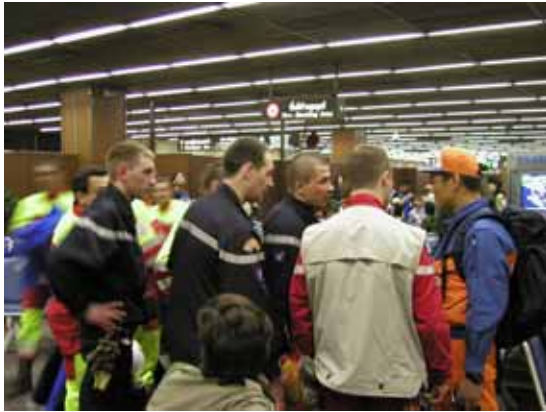
外国チームとの情報交換(12 / 29)