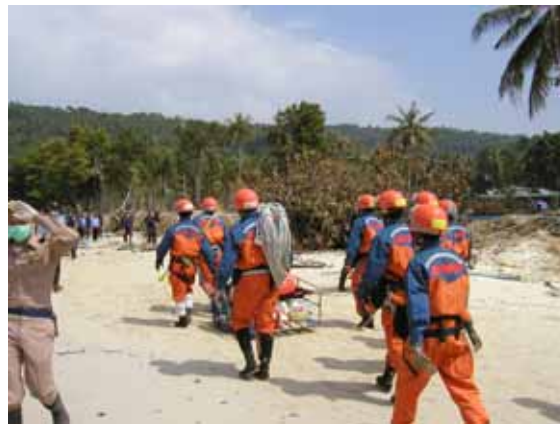
ビーチでの移動(12 / 31)