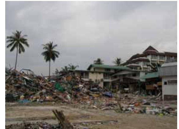
倒壊したホテル施設(1 / 1)