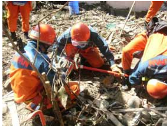
小型カメラを使用した搜索(12 / 30)