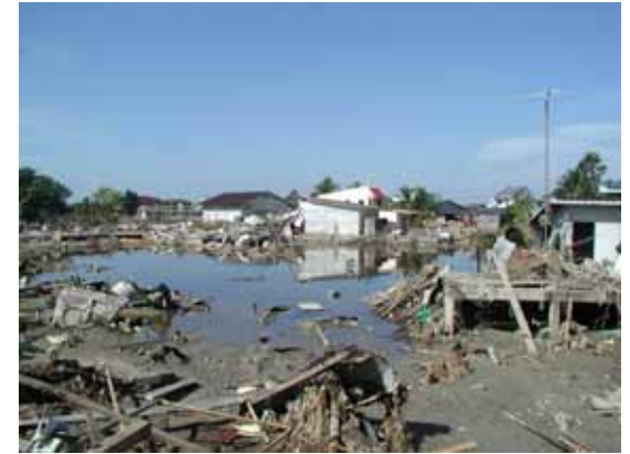
すず鋤床にたまった海水(12 / 30)