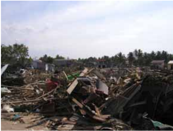
道路沿いの瓦礫(12 / 30)