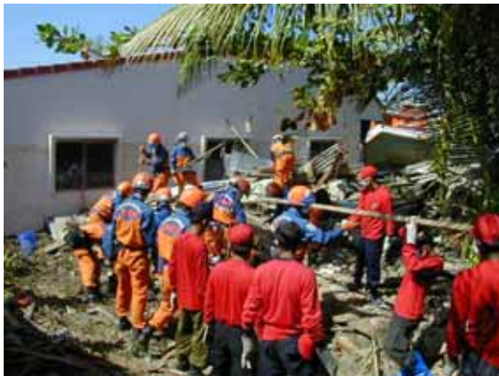
地元NGOとの共同作業(12 / 30)