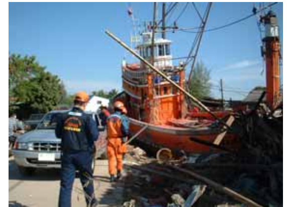
数百メートル陸上に打ち上げられた 漁船(12 / 30)