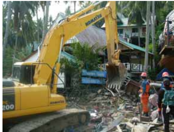
重機によるがれきの撤去(1 / 1)