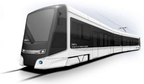
【導入車両のイメージ】