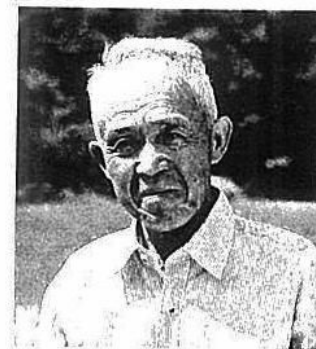
地区代表 藍内地区会長