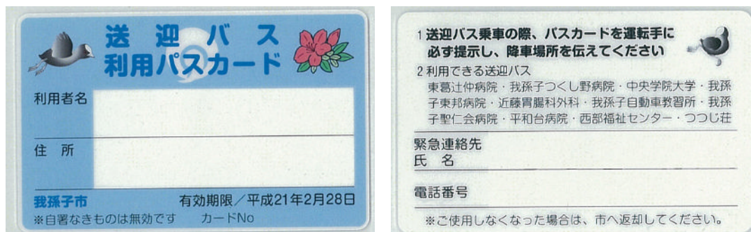
図. 送迎バス利用パスカード