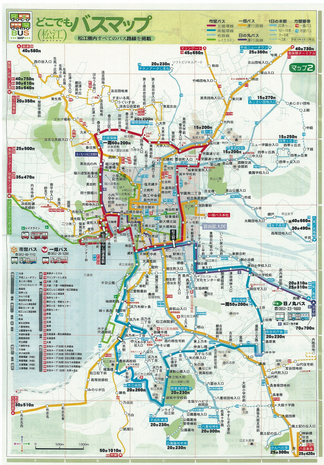
図. どこでもバスマップ (市街地)