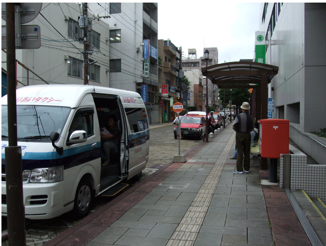
写真. 乗合タクシー乗降場およびタクシー乗り場