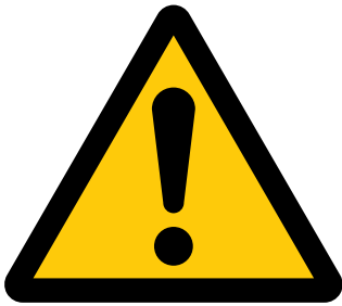
一般注意 General caution