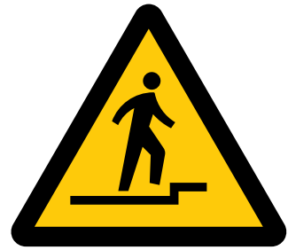
上り段差注意 Caution, uneven access / up