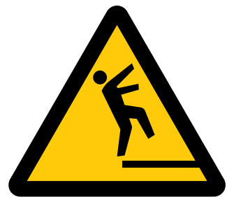
転落注意 Caution, drop [ 注1 ] 文字による補助表示が必要)