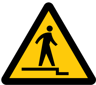
下り段差注意 Caution, uneven access / down