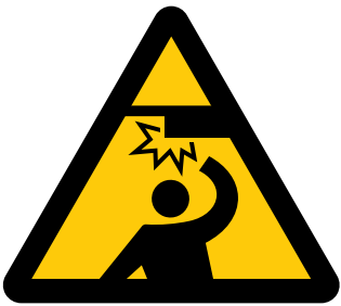
天井に注意 Caution, overhead