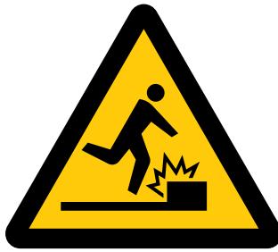
障害物注意 Caution, obstacles [ 注1 ] 文字による補助表示が必要)