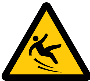
滑面注意 Caution, slippery surface