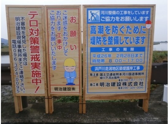
緑川水系浜戸川（熊本県宇土市） 『工事用看板』