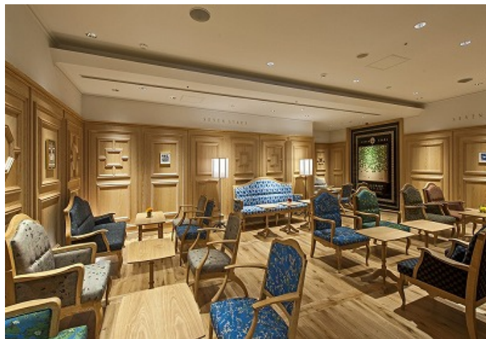
九州旅客鉄道(株)博多駅（福岡県福岡市）：博多ラウンジ「金星」