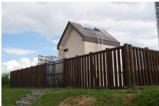
雄物川水系玉川（秋田県仙北市） 『防護柵工』