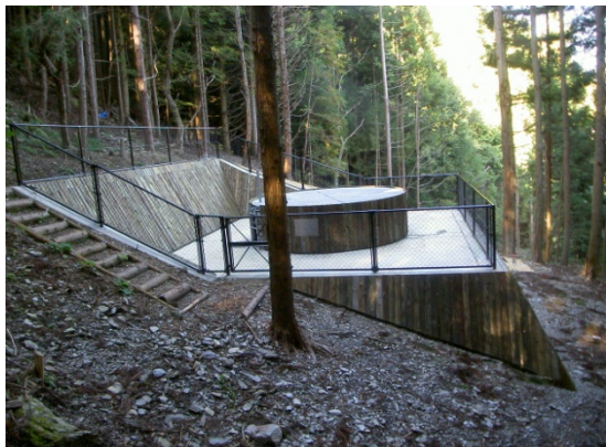
吉野川水系（徳島県三好市） 『集水井工（修景工）』