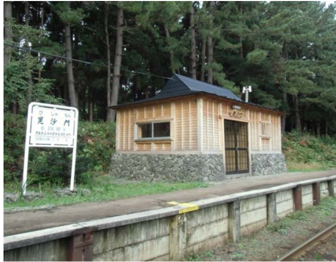
津軽鉄道(株)昆沙門駅（青森県五所川原市）：駅本屋