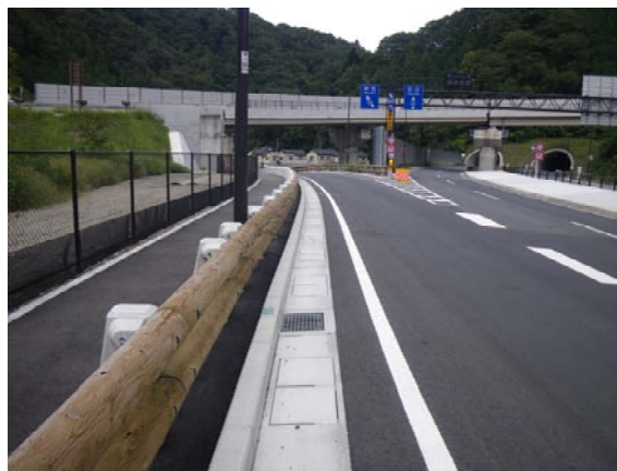
木製防護柵 圏央道高尾山IC（東京都八王子市）