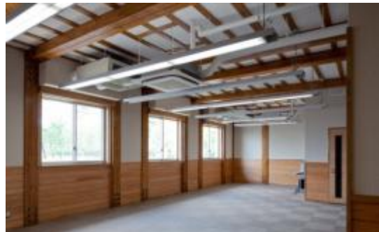
横浜植物防疫所つくばほ場(茨城県つくば市)：事務・検査棟