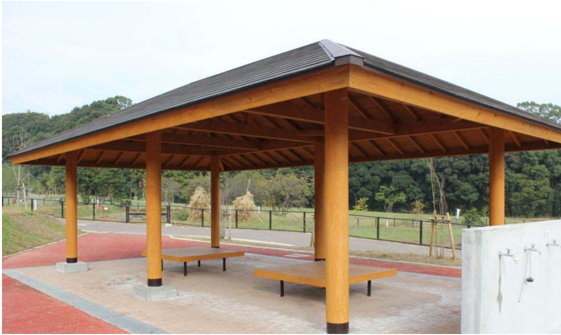
かなたけの里公園（福岡県福岡市）：あずまや