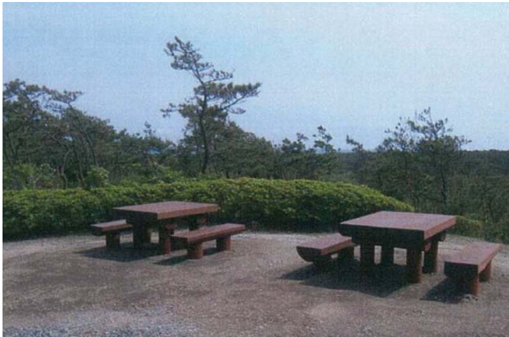
白砂公園（静岡県御前崎市）：テーブル・ベンチ