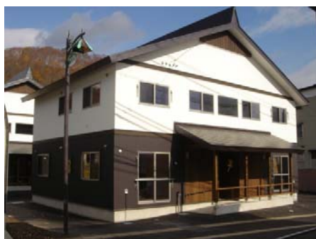
長野県栄村 青倉地区 外観