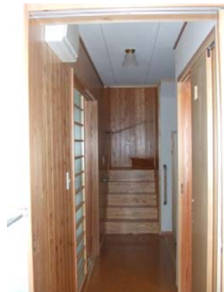
長野県栄村 青倉地区 内観