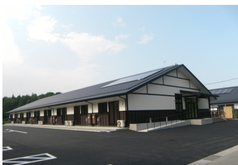
福島県相馬市 馬場野山田団地 外観