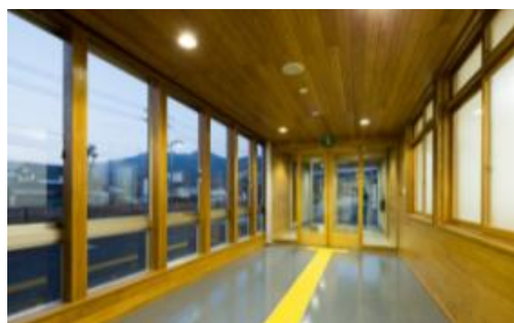
神戸税関境支署 (鳥取県境港市)：庁舎増築棟外観(左)、玄関ホール(右)