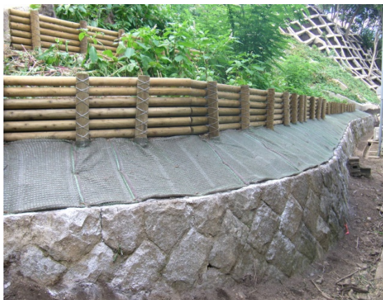
六甲山系（兵庫県神戸市） 『法面工（木柵工）』