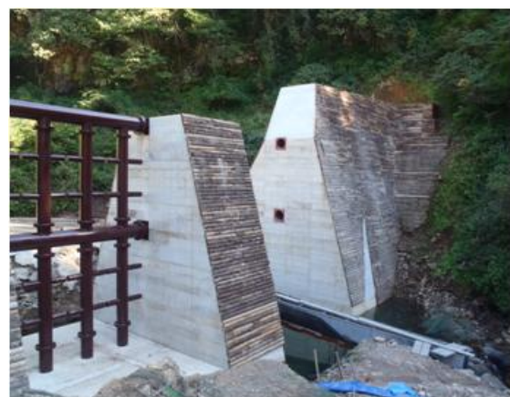
九頭竜川水系暮見川（福井県勝山市） 『砂防堰堤（木製残存型柵）』