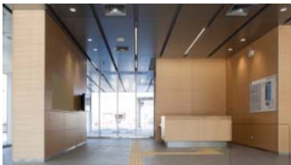
横須賀地方合同庁舎 (神奈川県横須賀市)：玄関ホール