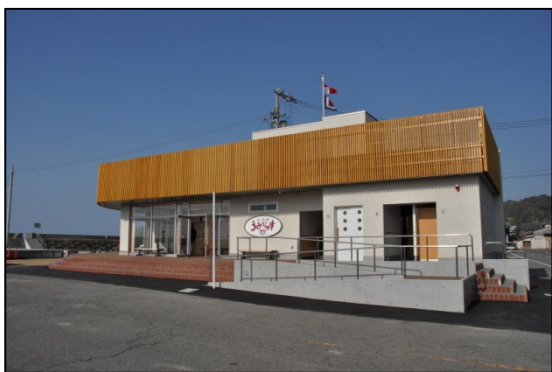
堀江港（愛媛県松山市）：休憩所