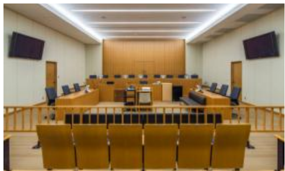
福島地方・家庭・簡易裁判所 (福島県福島市)：法廷