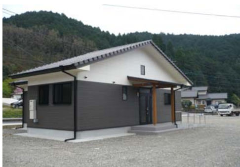
熊本県山江村 新城内団地 外観