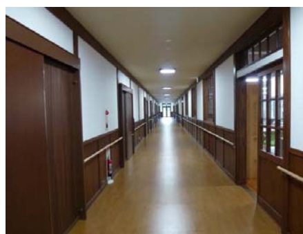
福島県相馬市 馬場野山田団地 内観