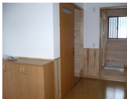
熊本県山江村 新城内団地 内観