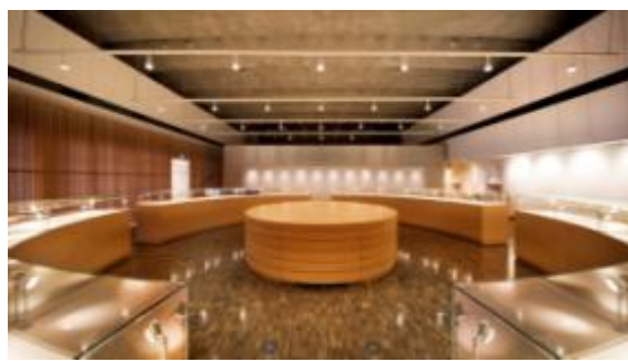
国立近現代建築資料館 (湯島地方合同庁舎) (東京都文京区)：資料室