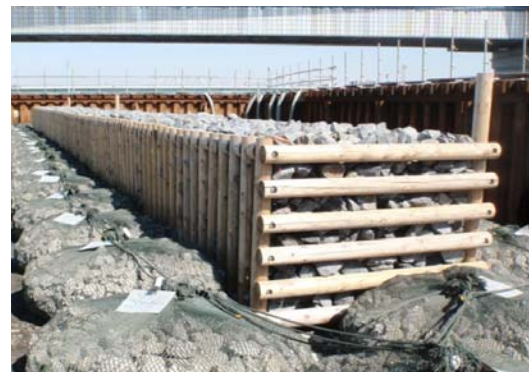
荒川水系荒川（東京都墨田区） 『木工沈床工』