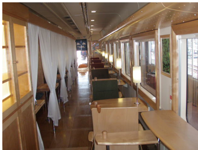
肥薩おれんじ鉄道(株)（熊本県八代市）：観光列車「おれんじ食堂」内装