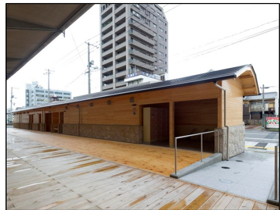
尾道糸崎港（広島県尾道市）：トイレ