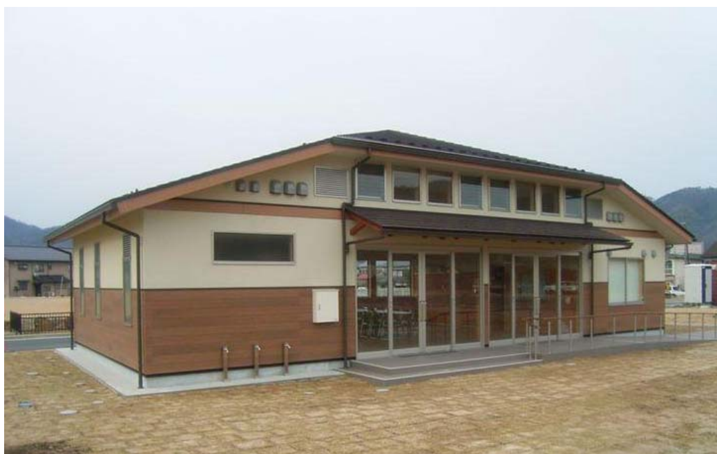
阿蘇シーサイドパーク（京都府与謝野町）：管理棟