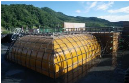
石狩川水系夕張川（北海道夕張市） 『型枠工』