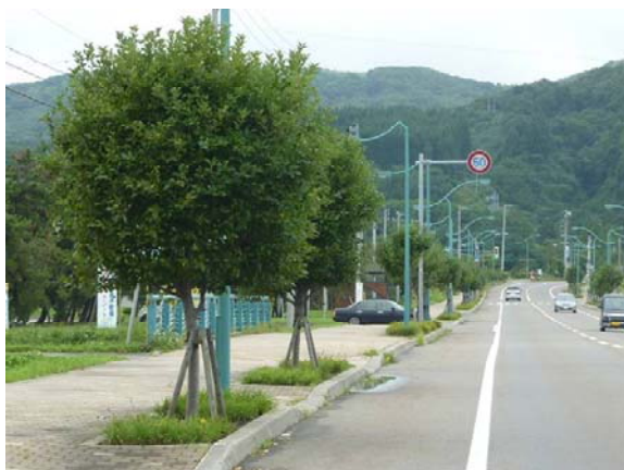
樹木の支柱 一般国道228号（北海道上ノ国町）