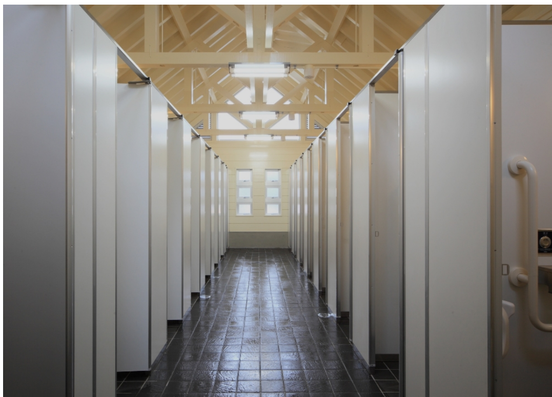
国営常陸海浜公園（茨城県ひたちなか市）：トイレ棟