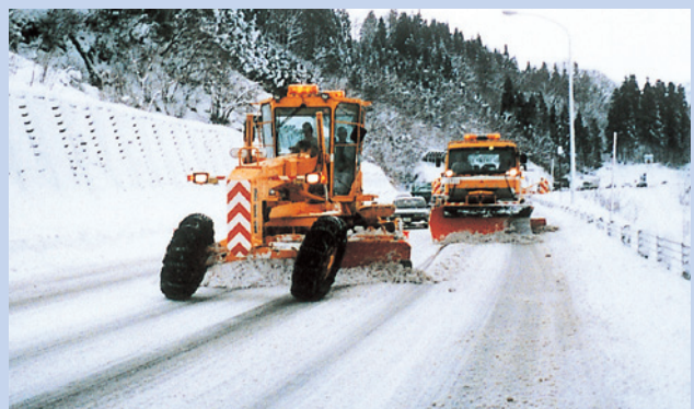
除雪グレーダと除雪トラックによる作業