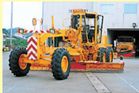
除雪グレーダ 高速圧雪整正機