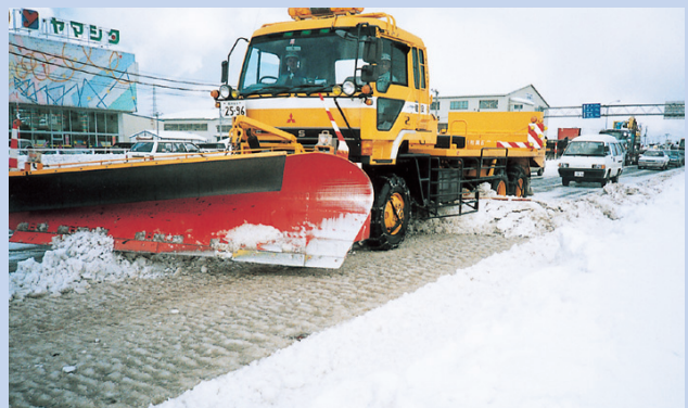
除雪トラックによる作業