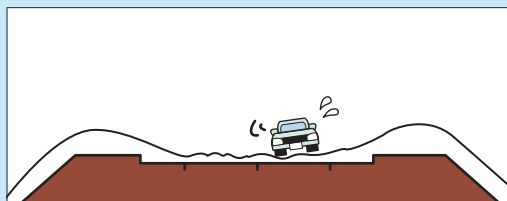
凹凸になった路面