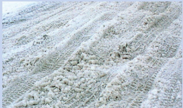
凹凸になった路面