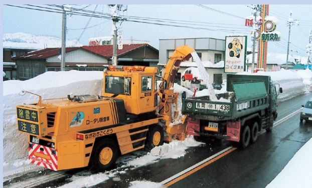
ロータリ除雪車による積み込み作業