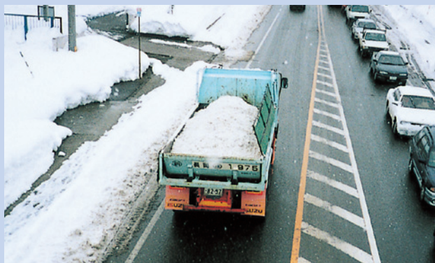
ダンプトラックによる運搬作業