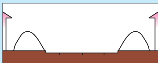
路側に堆積した雪