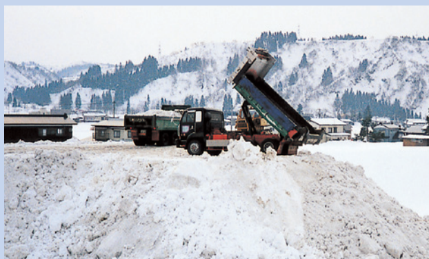
ダンプトラックによる雪捨て作業