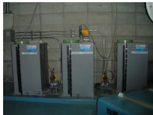
酸化剤タンク、中和剤タンク