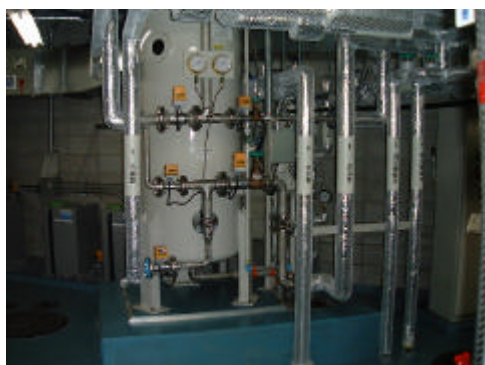
雨水・井水ろ過装置