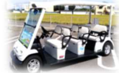
グリーンスローモビリティ