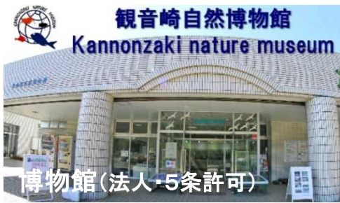
博物館(法人・5条許可)