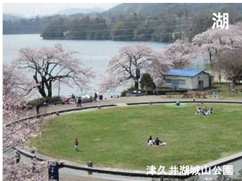
津久井湖城山公園