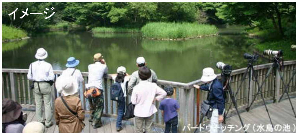
Kanagawa Prefectural Government