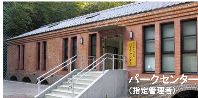
パークセンター(指定管理者)