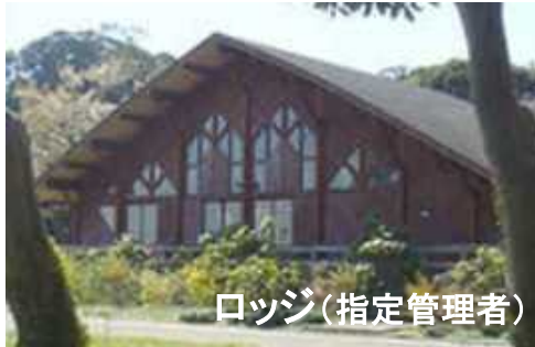
ロッジ(指定管理者)