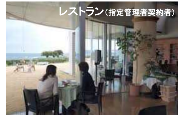
レストラン(指定管理者契約者)