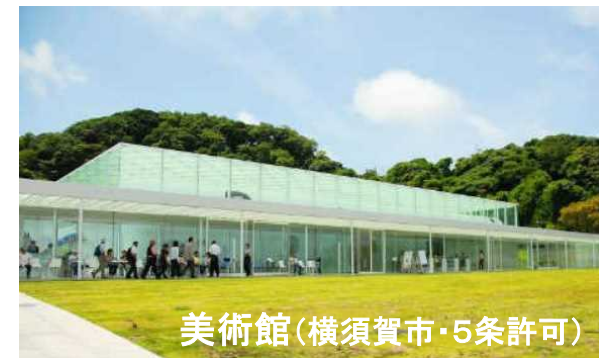
美術館(横須賀市・5条許可)