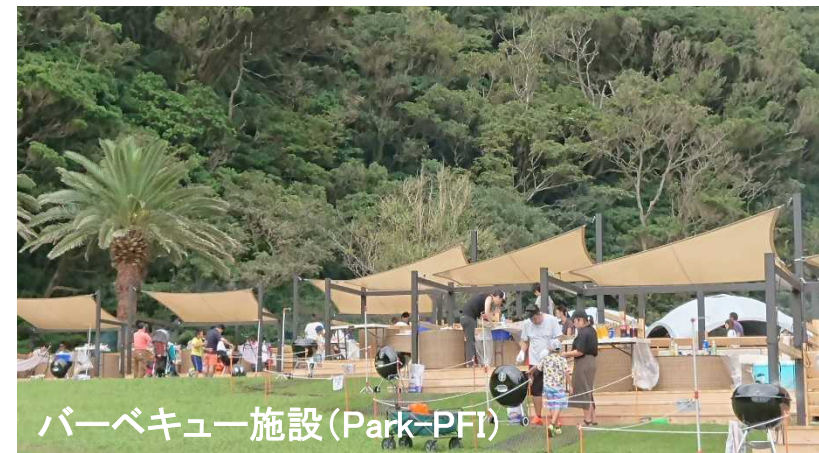
バーベキュー施設(Park-PFI)