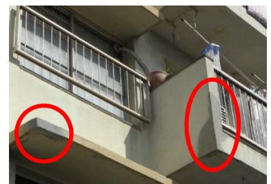
事後的修繕工事の一例

○マンションでの修繕には、発生した不具合に対応する事後保全的修繕工事と、計画的に実施する計画修繕がある。 ○計画修繕を進めるため、管理組合は、修繕を実施する方針、修繕箇所、工事業者等につき段階を踏みながら決定する必要がある。