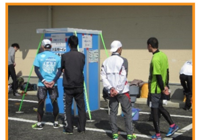
クロスカントリー大会で使用（恵那市）