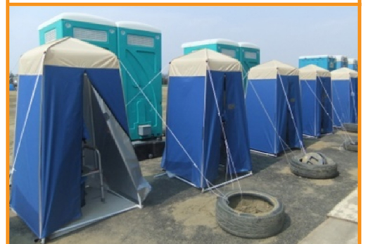
東松島市にて、2箇所の避難所に設置されました。約900人の避難者が利用しました。