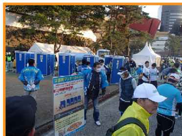
マラソン大会で使用（北九州市）

マンホールトイレを実際に使用することで、設置、使用、片付けを一連に訓練することができるのと同時に、多くの住民の方にマンホールトイレをPRすることにもなります。