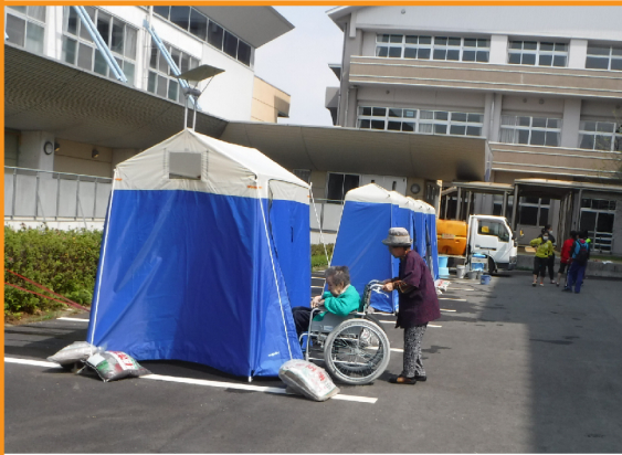
熊本市にて、避難所となった4箇所の中学校に設置されました。最長35日間使用されました。