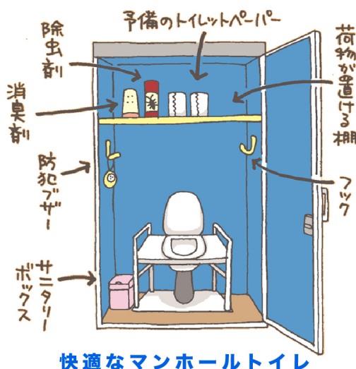
快適なマンホールトイレ