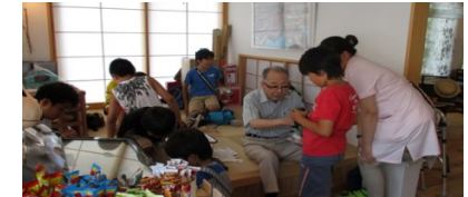
高齢者生活支援施設における地域交流(イメージ)