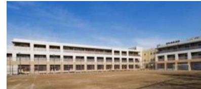
学校を改修して整備した住宅