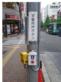
＜音響機能付加信号機の例＞