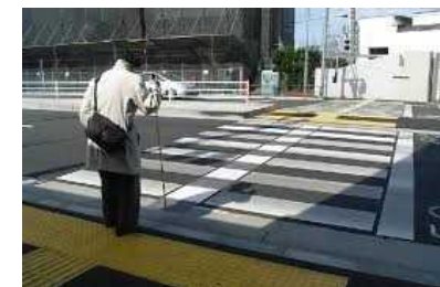
＜エスコートゾーンの例＞