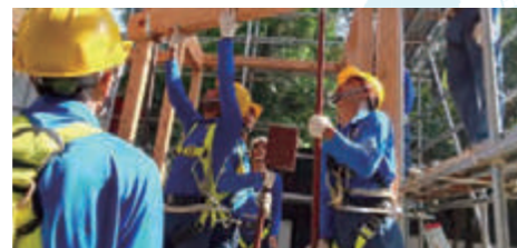
バングラデシュ訓練施設内、建て方訓練