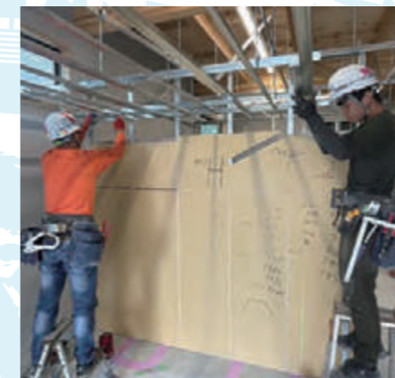
社内研修実地訓練①

日本が好きになり、日本の生活に馴染むよう望みます。また、日本で様々なスキルや資格を習得し、キャリアアップして働くことで収入アップへ繋げ、質の高い技術、技能を発揮できる人材になってくれることを期待しています。