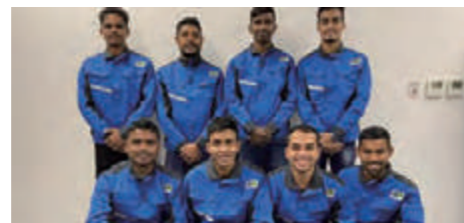
バングラデシュ実習生入社式