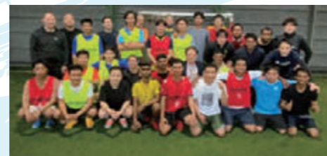
ミャンマー、バングラデシュ合同フットサル大会