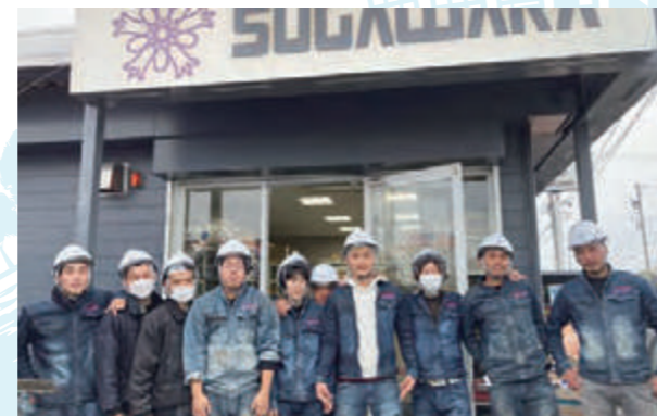
支店での集合写真