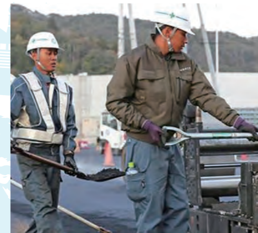
国内での作業状況

皆さん現場での活躍にはいつも感謝しております。叶えたい目標を持ち日本に来て、頑張る姿勢は素晴らしく、他にも日本語の学習、地域での交流事業も率先して参加してくれる事は本当に嬉しく思います。これからもインドネシアと気仙沼を共に繋いで行きましょう！