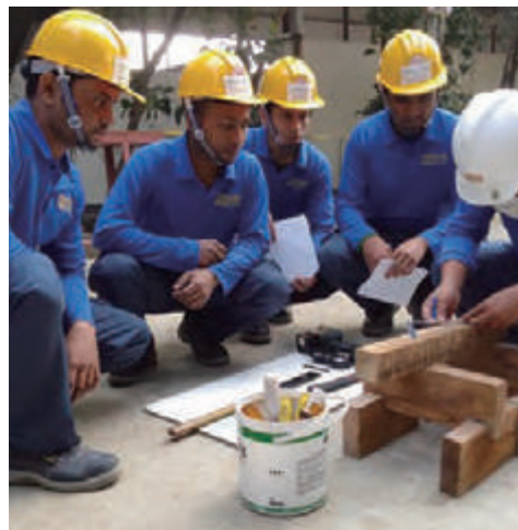
バングラデシュ訓練施設内、座学訓練

技能実習生として建築技能を日本で取得し、母国に貢献する。そして更なる技能の高みを目指して特定技能外国人として日本の建築現場に戻り、その実力を発揮しつつ安心安全な生活を追求する、こうした外国の方々を、様々な形で支援します。一緒に働きましょう！