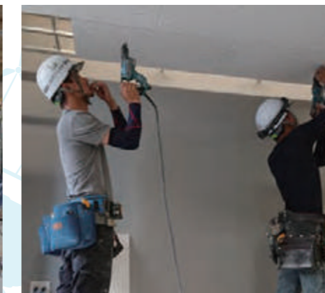
社内研修実地訓練②