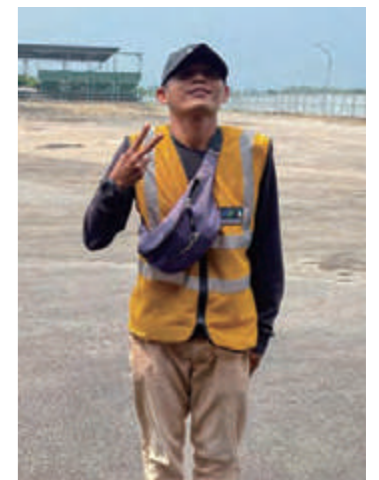
現地で活躍する元技能実習生