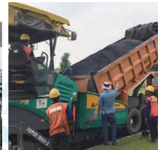
インドネシアでの作業状況