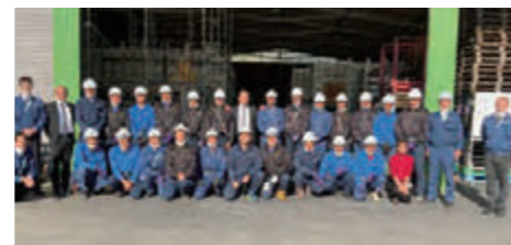
国内訓練施設でのミャンマー実習生集合写真