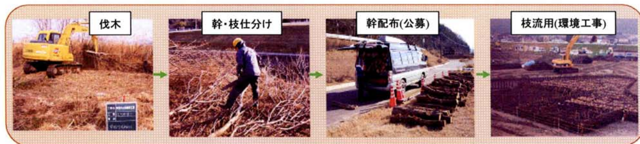
図－5 伐採木の活用状況

「枝」＝粗朶工法については、環境に優しい伝統工法の材料として活用したことが地元の新聞紙に大きく報道されるなど、利用に加え事業のPRにも大きな効果があった。