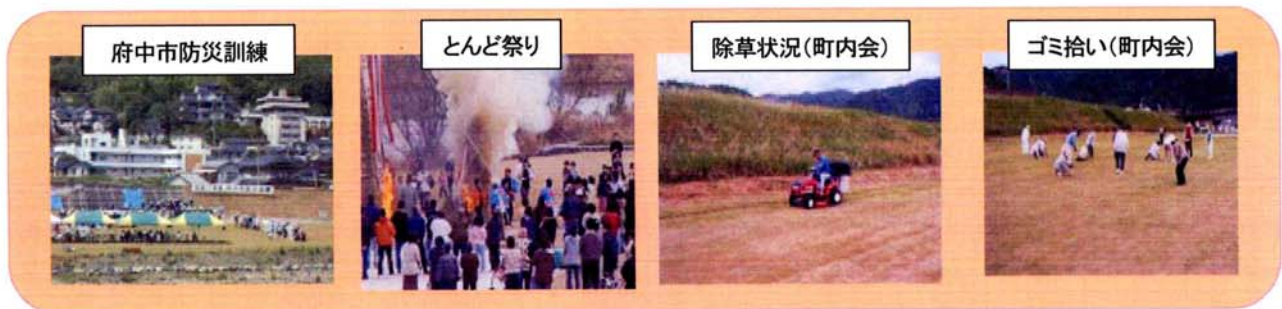
図－2 利用及び維持管理状況

評価： 消防訓練やとんど祭りなどの地域に密着したイベントが開催され、同時に草刈りやゴミ拾いなどの日常管理が町内会により行われており、地域活動のオープンスペースとして愛着をもって活用されている。